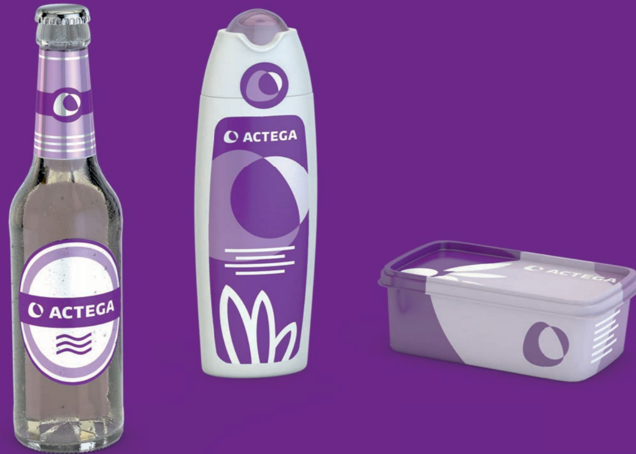
Pressure Sensitive Wet Glue In-Mold

Etiketten sagen viel aus über das Produkt und dessen Hersteller. Sie enthalten Informationen und differenzieren die Marke vom Wettbewerb. Wichtig ist, dass alle Etiketten-Komponenten die höchste Qualität aufweisen, von der Druckfarbe bis hin zur wertsteigernden Veredelung. Entdecken Sie unsere Lösungen für die unterschiedlichen Etikettenarten.